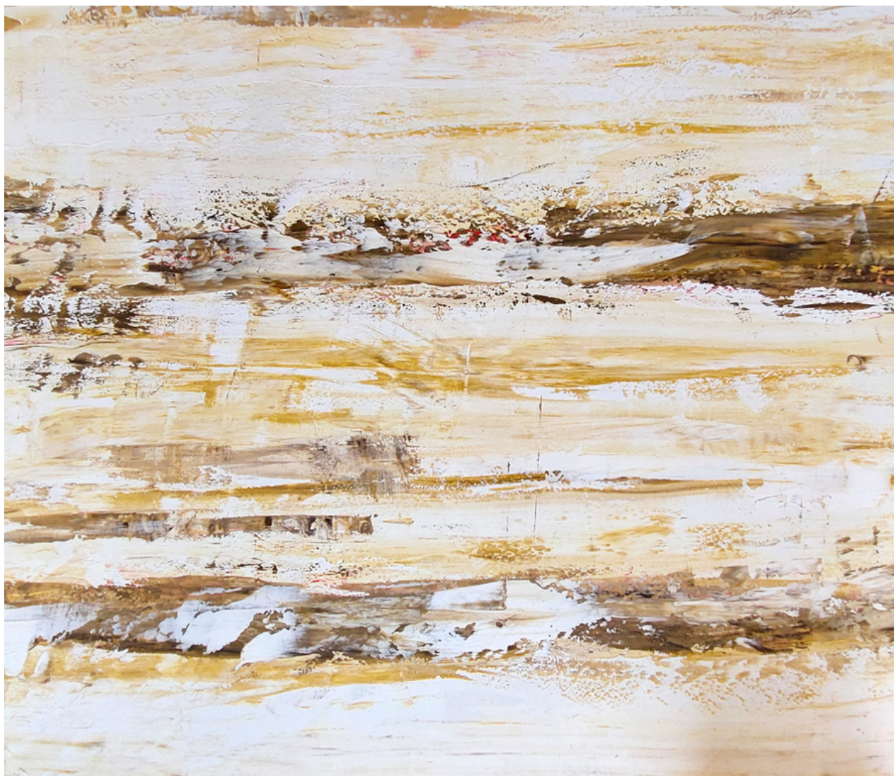
OUTONO 2023 139x156 cm Tinta autoral sobre tela