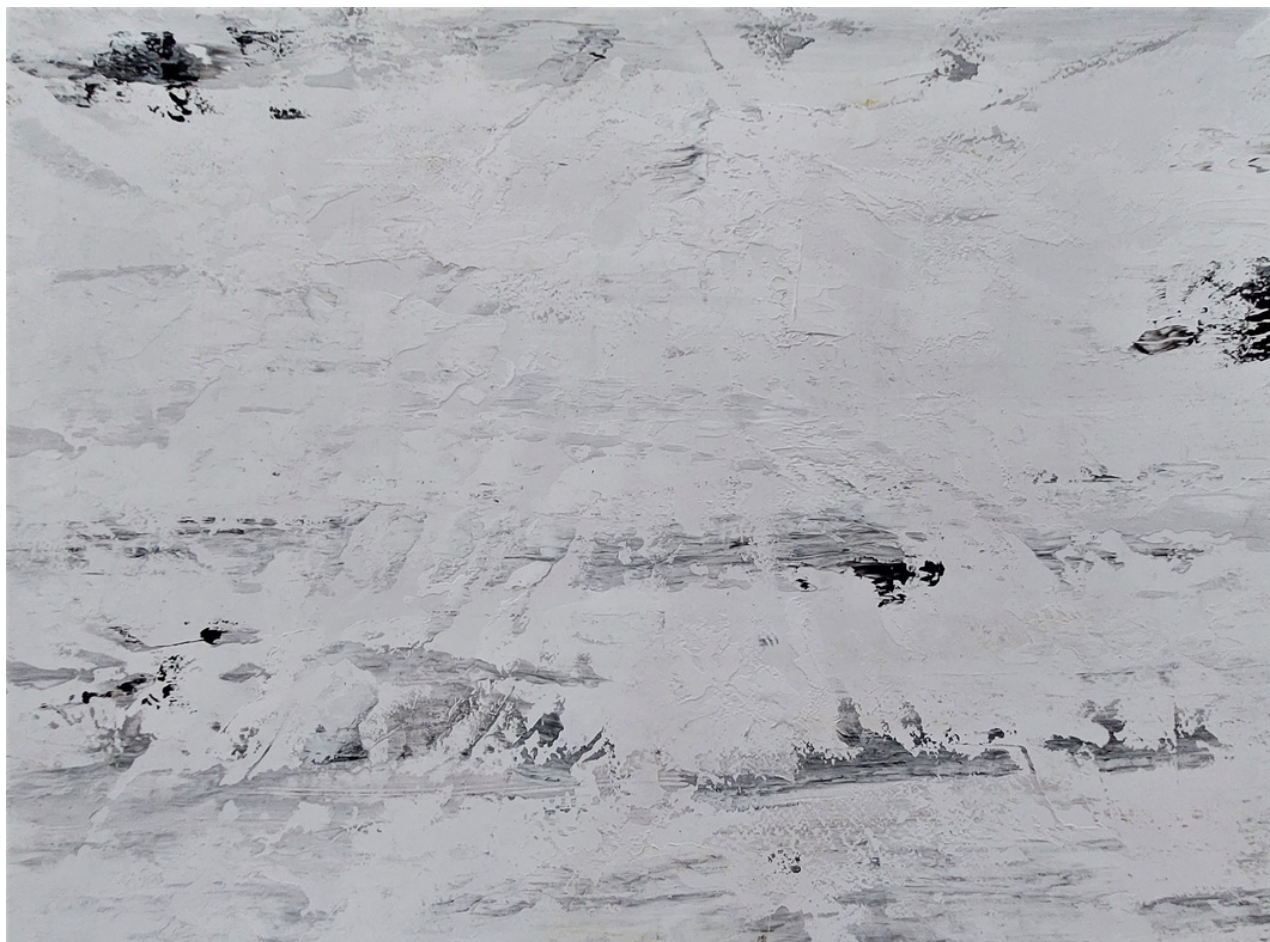
INVERNO 1 2023 116 x 155 cm Tinta autoral sobre tela