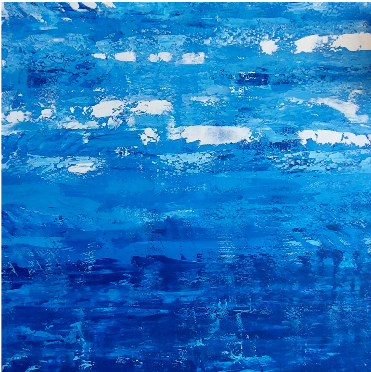
MARINHA 2023 145 x 141 cm Tinta autoral sobre tela