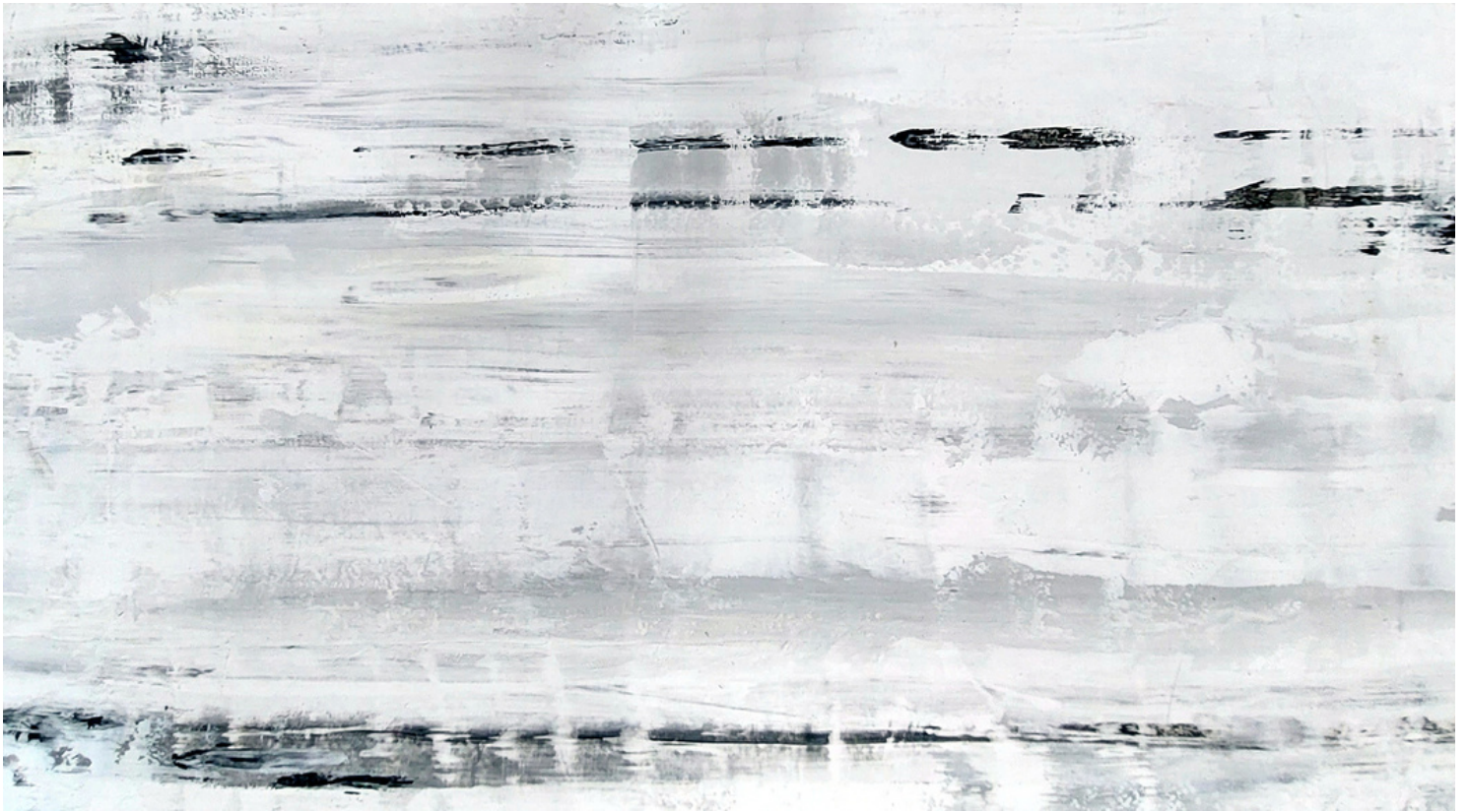
INVERNO 2, 2023 72 x 132 cm Tinta autoral sobre tela