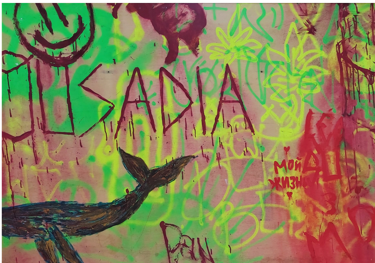
QUIMERA 2023 139x156 cm Tinta autoral sobre tela