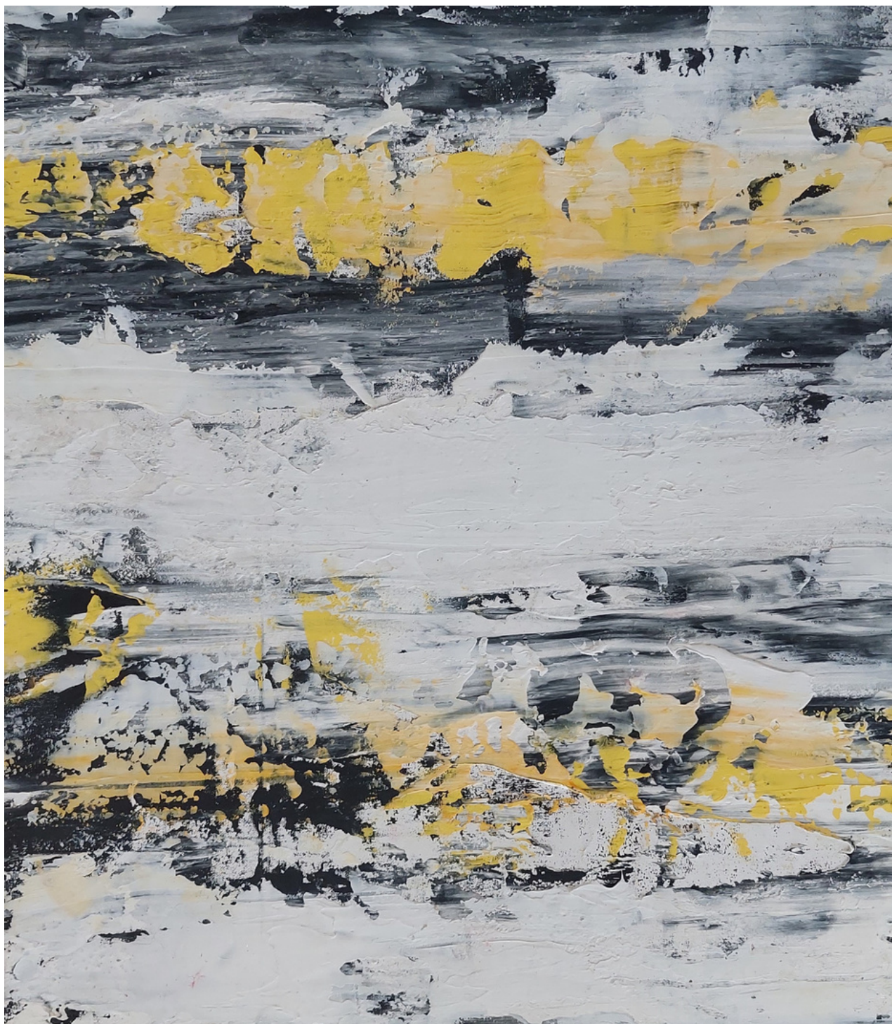
INVERNO COM SOL 2023 73 x 63 cm Tinta autoral sobre tela